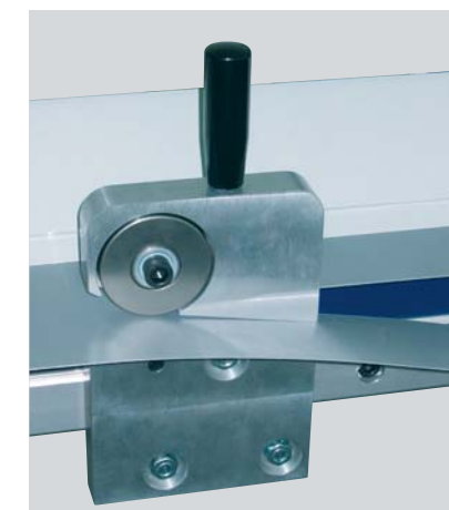
Mit dem Schneidkopf werden Bleche exakt und schnell geschnitten.