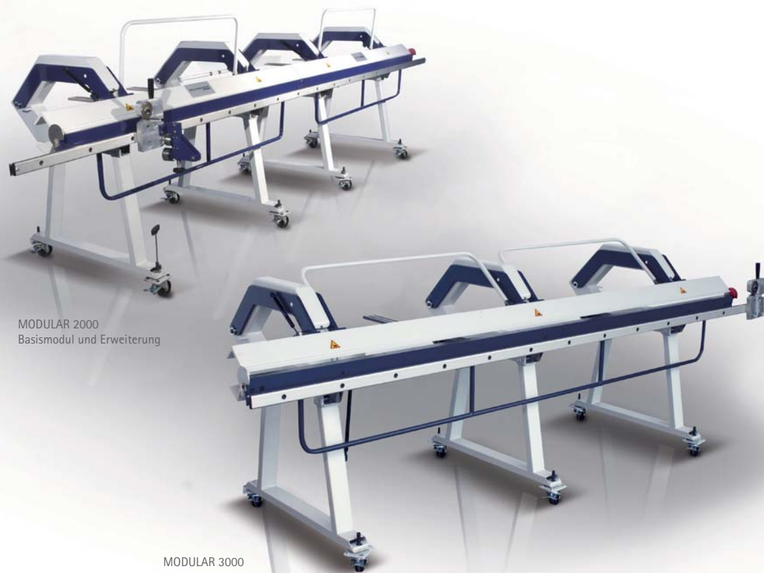
MODULAR 2000 Basismodul und Erweiterung

MODULAR ist die modular kombinierbare Abkantmaschine von Schröder, die die Profilierung beliebig langer Bleche erlaubt – direkt auf der Baustelle.