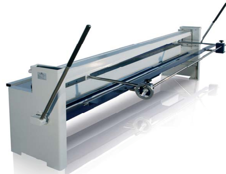
Manuelle Exzenter-Tafelschere HS

Die Tafelschere Modell HS ist eine manuelle Exzentertafelschere und wird für nahezu sämtliche Schneide-Probleme eingesetzt. Gratfreies, verwindungsarmes und nahezu kraftloses Schneiden sind die Merkmale dieser Tafelschere.