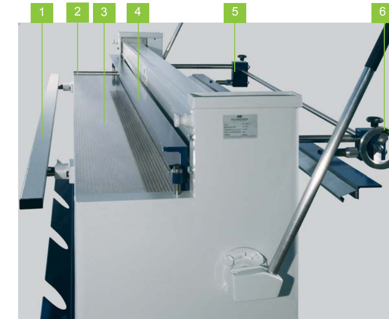
Manueller Hinteranschlag mit Skala und Handradverstellung [6] für parallele und konische Schnitte. Die Einstellung wird an den Winkel-führungen [5] durchgeführt.

Die manuelle Exzentertafelschere kann bis zu 2 mm starke Stahlbleche mühelos und gratfrei von Hand schneiden. Darüber hinaus bietet sie dem Bediener zahlreiche Ergänzungsoptionen.