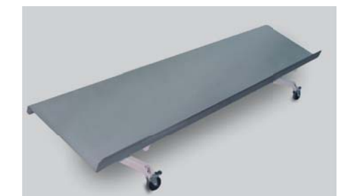
Rutschenwagen mit 4 Lenkrollen

Um eine einfachere Bedienung zu ermöglichen, eignet sich der von vorne verstellbare manuelle Hinteranschlag mit Digitalanzeige. Mit dieser Option erspart sich der Bediener den Gang um die Maschine, weil er direkt von vorne das Anschlagmaß exakt einstellen kann. Auch hier komplettiert die Blechhochhaltevorrichtung in Verbindung mit Blechrutsche oder Rutschenwagen das System.