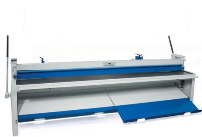
Teleskopblechrutsche inkl. Stapelfunktion