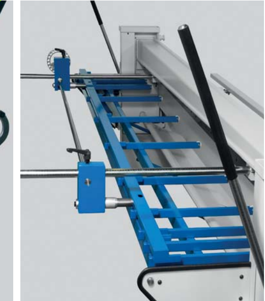
Optional: Mechanische Hochhaltevorrichtung für manuellen Hinteranschlag 500 mm oder 750 mm