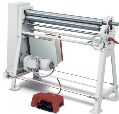
125 Motorische Rundbiegemaschine

Die kleine Rundbiegemaschine 102 wird auf Baustellen wie auch in Werkstätten gerne eingesetzt. Wegen der hohen Rundformungsgenauigkeit steht sie auch im Modellbau und in den Lehrwerkstätten. Wer Schröder-Fasti kennt, findet was er sucht: Steife Konstruktion, solide Dimensionen, stabile Lager, hohe Werkzeuggenauigkeit.